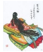
先生直筆の表紙絵