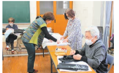
参加者の多くが自分で作った洋服を着て参加しています

【記事に関する問い合わせ先】 区企画振興課 ☎559・5017 ☎559・5014