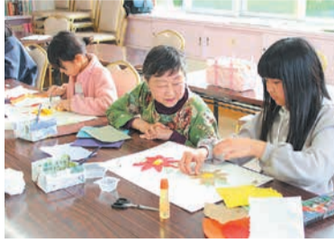
和紙をちぎって花を再現

区役所代表電話 ☎561-2131 区ホームページ 福岡市南区 検索 〒815-8501 南区塩原三丁目25-1 窓口受付時間: 午前8時45分～午後5時15分 (土日・祝休日・年末年始を除く) 区の広報担当キャラクター 「ため蔵」くん