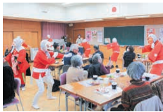
校区の地域カフェに出演

☎区社会福祉協議会 ☎554-1039 ☎557-4068 ☎メンバーの3分の2以上が区内在住で、地域福祉の振興に貢献する事業を行う団体 ☎6月28日(金)午後5時までに申し込み