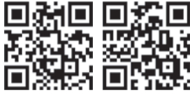
市民プール 体育館は はこちらから はこちらから

●南市民プール 「第1期アクアビクス教室」、水上アトラクションを体験する「ウォーターランド」を実施。 ●南体育館 「身体のゆがみ測定会」を実施。 詳細は、ホームページ（「福岡市 南市民プール」または「福岡市 南体育館」で検索）でご確認ください。