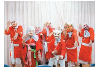
出演した衣装で決めポーズ

正解 ③ひよっこ踊り 「野多目福笑会」は、11人のメンバーが毎週火曜日に野多目公民館で練習している公民館サークルです（公民館サークル名は「日向ひよっこ踊り」）。