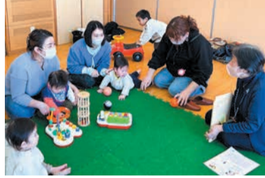
成長に合わせて離乳食のアドバイスを行いました

者は、「子どもも慣れて、『公民館に行く?』と聞くと、『行く!』と元気よく返事します」と話してくれました。近くに引っ越してきたばかりの1歳児の保護者は、「4月から保育園なので、今日はその練習に来ました」と話しました。