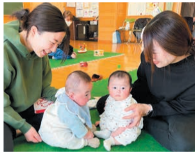
保護者同士で子育て情報を交換し合っています

3月8日には、生後4カ月~2歳の乳幼児と保護者13組が集まり、サロンのおもちゃや絵本で自由に遊びながら楽しいひとときを過ごしました。この日は、区役所の地域保健