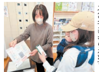
「おもつと安心定期便」スタンプももらえます

さい頃から友達や大人と触れ合うことは、貴重な体験になると思っています。お子さんのペースでゆっくり過ごせて、保護者もほっと一息つける場所です。気軽に遊びに来てくださいね」と話しました。