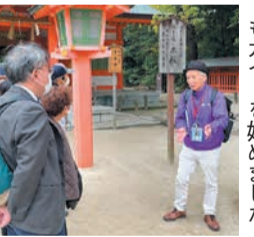
今月から住吉神社でもガイドを始めました

「博多ガイドの会」は、歴史や伝統が息づく博多のまちを専門に案内する観光ボランティアガイドです。下記の観光スポットで、紫の法被を着たガイドに声を掛けてください。無料で歴史や見どころについて解説します。※時間帯によっては不在の場合もあります。夏期冬期はお休みです。