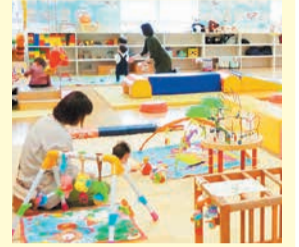
山王子どもプラザ

子どもプラザは、乳幼児の親子がいつでも利用できる遊び場です。他の親子と交流できるほか、子育てに関する相談もできます。