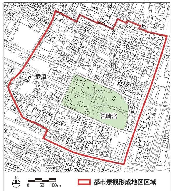
※東区箱崎一丁目及び馬出五丁目の各一部

建築物又は工作物の新築、増築、改築若しくは移転、外観を変更する修繕又は模様替え、外観の色彩の変更を届出対象とします。また、屋外広告物については、屋外広告物法による許可が必要です。