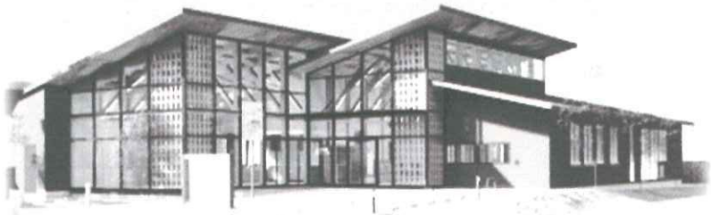
※照葉はばたき校区の新設公民館外観イメージ