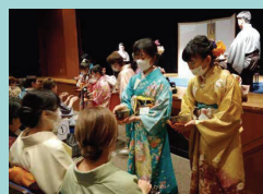
さくら茶会 福岡市茶道文化連盟