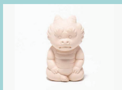
博多人形絵付け 中村人形