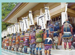
黒田二十五騎武者行列 主催:福岡城・鴻臚館まつり