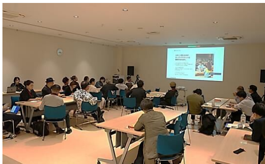
▲ワークショップの様子

その徒歩圏内に位置する、6つの商店街(※)は、2023年夏からワークショップを実施し、観光客誘客のための計画作りを進めてきました。