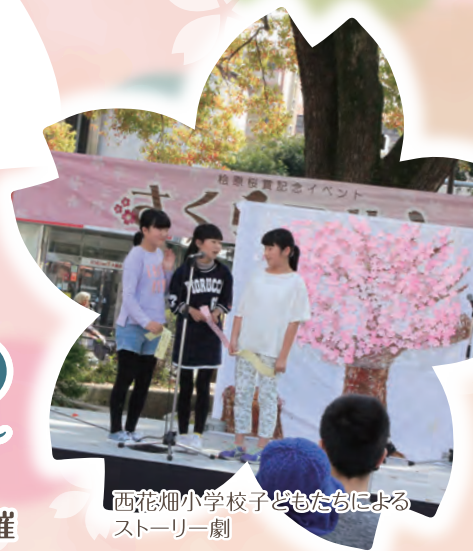
西花畑小学校子どもたちによるストーリー劇