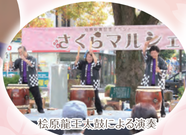
松原龍王太鼓による演奏