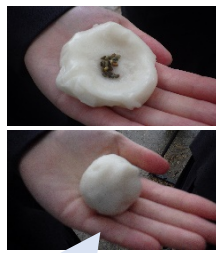
アマモの種を寒天団子で包んで海に投げ入れます。