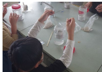
小学校の環境学習