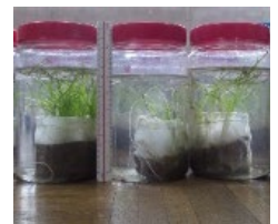
小学生が育てたアマモポット苗