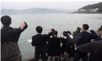
アマモの種を海に投入

クレジットの販売収益を活用して、令和5年度は、志賀島や今津の海岸でアマモの種を海に投げ入れてアマモを増やす活動や、小学校の環境学習でアマモポット苗を育てる活動などを実施しました。