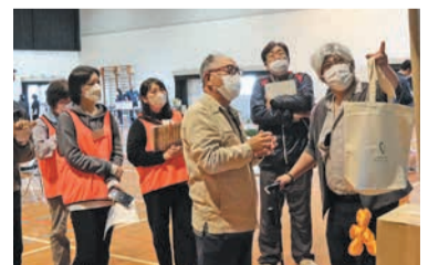
気付いたこと等を互いに話し合います

地域住民は、「認知症サポーター養成講座」を受講後、ステップアップとして、「さわらまんなかネット」のメンバーが扮する認知症の人