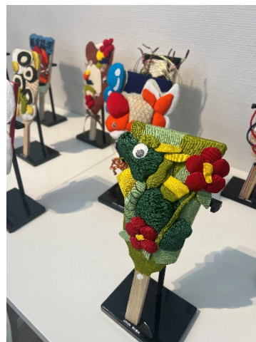
↑学生が新しく制作した「博多おきあげ」