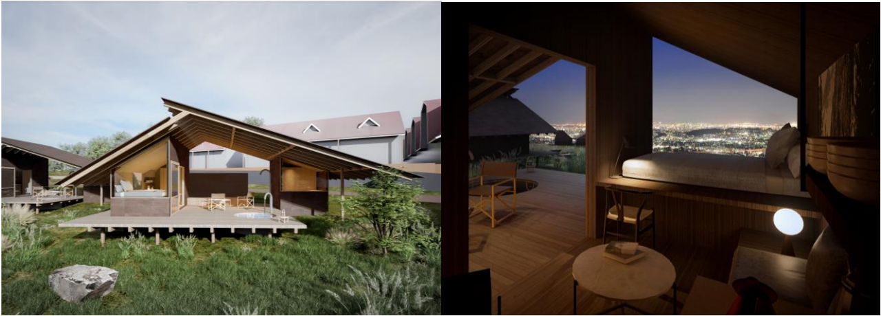
[客室詳細 - COTTAGE]

アウトドア・リビングでは、プライベートサウナで整い、大切な人とお食事を愉しむことができます。また、寝室の大きな窓ガラスから見える夜景を眺めながら眠りにつくことが出来るのもコテージの特徴です。