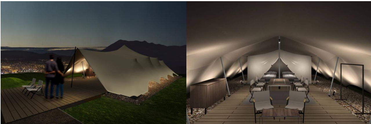
[客室詳細 - TENT]

スノーピークが YAKEI SUITE のために開発した特別仕様のテント「LAND CAVE ランド ケイヴ 」。キャンプ体験に近づけることを考えて設計されたテントでは、幕一枚越しに自然を感じる贅沢さを味わうことができます。