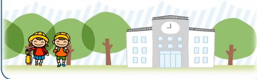
イラスト著作権 がくげい