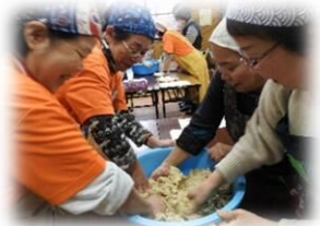
(前回の様子) ※衛生連合会共催事業

【時間】10:00～12:00 【講師】JA まめひめさん 【場所】公民館 学習室 【定員】20名 【持ち物】エプロン・三角巾・マスク・ハンドタオル