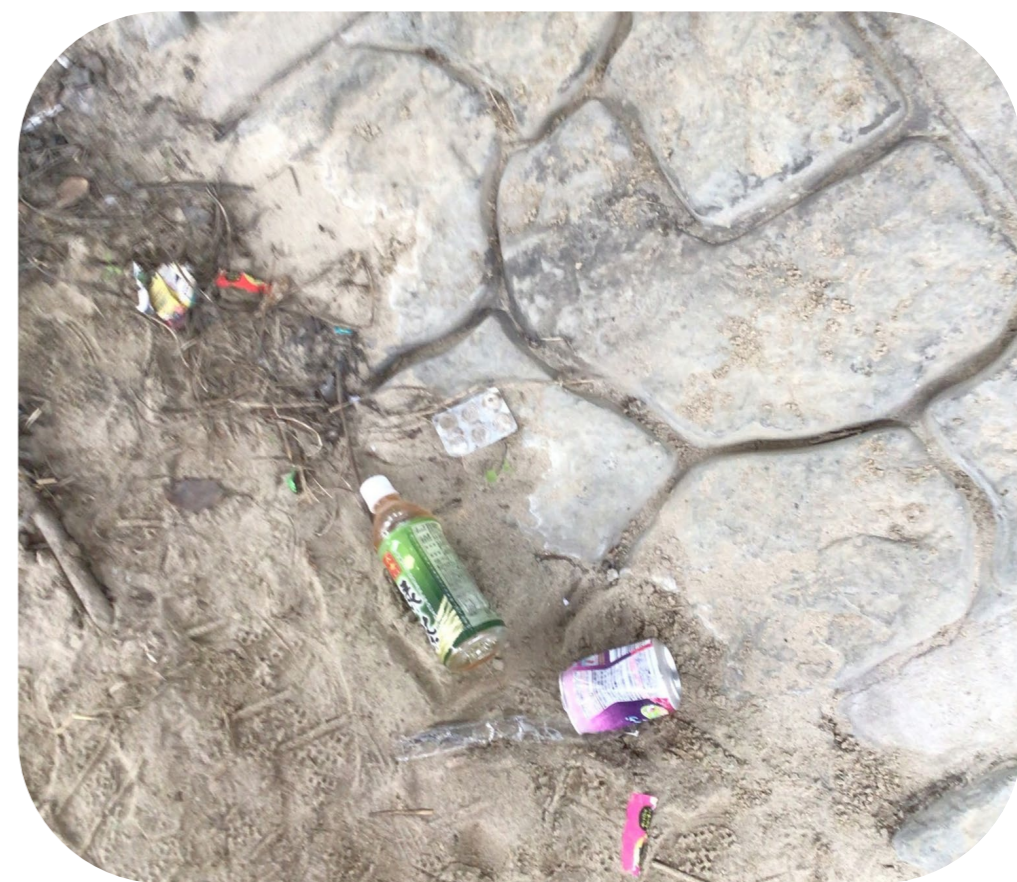
↓写真1 那珂川周辺の河川敷

現在のポイ捨ての現状は、 極めて深刻 です。写真は福翔高校を含めた周辺の地域で見つかったゴミです。写真1では ペットボトルやタバコの吸い殻、お菓子のゴミ などがポイ捨てされています。福翔高校内では、 人工芝などのプラスチックゴミ の他にもいろいろ落ちていました。