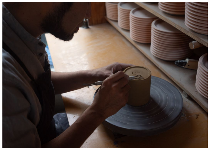
オリジナルカップを製作いただいている様子