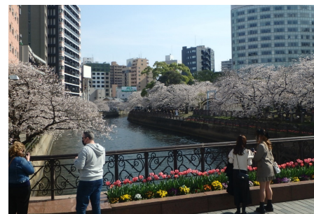
二級河川 薬院新川 (中央区天神)