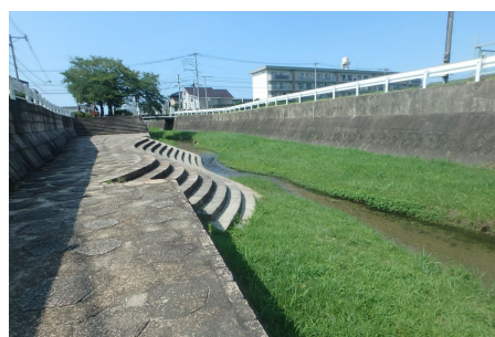
二級河川 油山川 (早良区干隈)