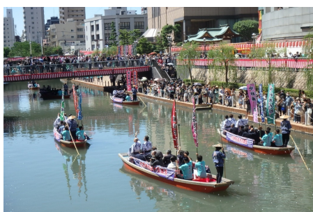
準用河川 博多川 (博多区中洲)