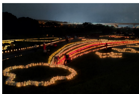
二級河川 室見川 (早良区有田)