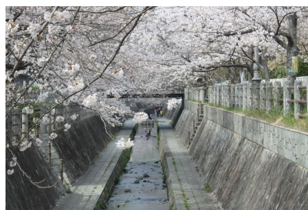
準用河川 一本松川 (城南区堤)