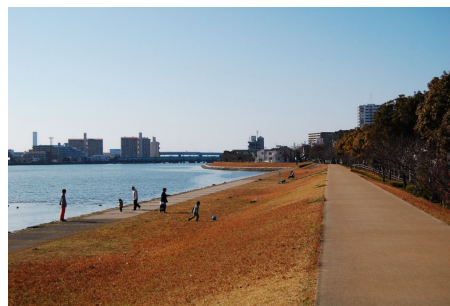
二級河川 多々良川 (東区名島)