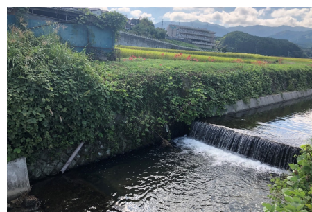
普通河川 大谷川 (早良区内野)