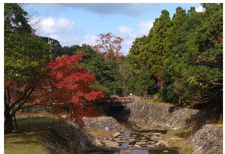
普通河川 七寺川 (西区今宿上ノ原)