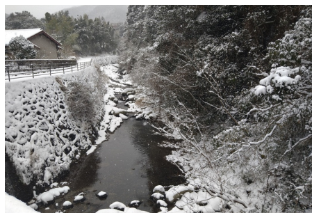
二級河川 椎原川 (早良区椎原)