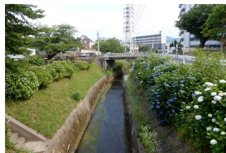
準用河川 駄ヶ原川 (城南区樋井川)