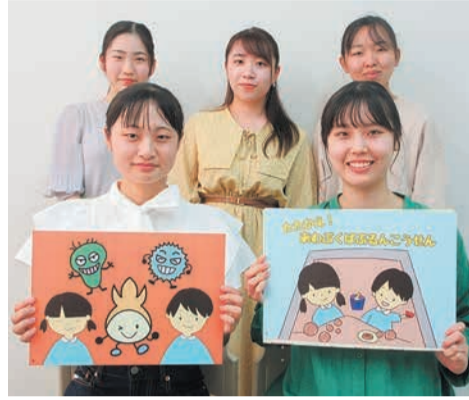
完成した紙芝居を手にする学生

区は、「地域と大学が共生するまち」を目指し、区内にある大学と連携してさまざまな事業を行っています。