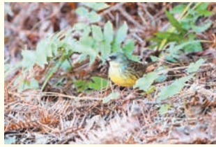
アオジ (油山市民の森)