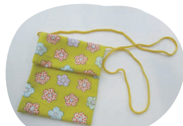
てぬ 手縫いで小物づくり