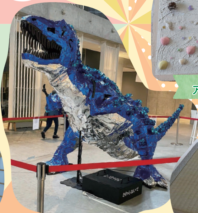
ヒガシクサウルスプロジェクト 飾り付けワークショップ