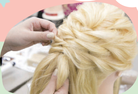
ヘアアレンジ体験