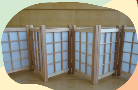
しょうじついたて ミニ障子衝立づくり