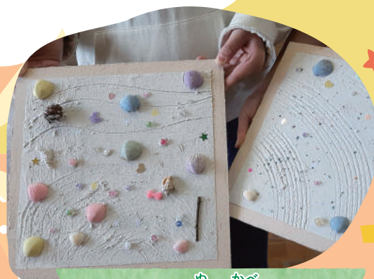
ぬかべ アートな塗り壁づくり