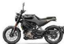
Husqvarna Svartpilen 401