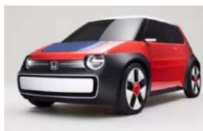
WP SUSTAINA-C Concept