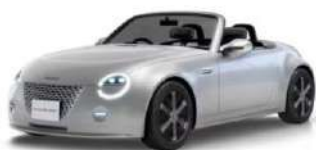
WP VISION COPEN