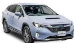
LEVORG LAYBACK Limited EX