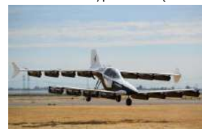
⑥ 福岡モビリティショー2023 出展予定 Mk-05 (teTra aviation corp.)