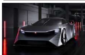
WP Nissan Hyper Force