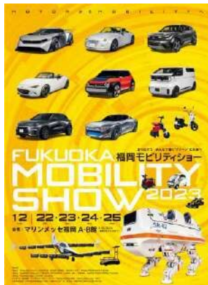
① 福岡モビリティショー2023 公式ビジュアル_01

「福岡モビリティショー2023」の告知・広報にご協力いただける場合、下記の画像をご用意しております。 お手数ですが下記申込み用紙にご記入の上、事務局宛にメールかFAXにて送信くださいますようお願いいたします。