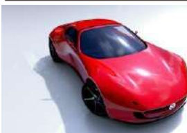
WP MAZDA ICONIC SP