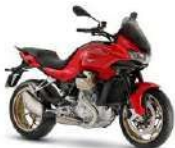
MOTO GUZZI V100 Mandello