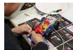
⑩ 福岡モーターショー2019の様子 (こども向け体験イベント)

※上記以外の「福岡モビリティショー」の出展車両は公式HPに公開しております。画像をご希望の方はご連絡ください。 ※写真の使用は本事業の紹介記事に限らせていただきます。