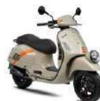
Vespa GTV 300