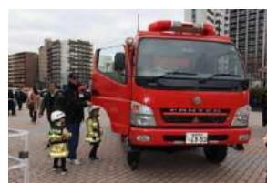
⑨ 福岡モーターショー2019の様子 (はたらくクルマ)