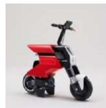
WP Pocket Concept