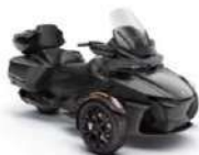
can-am BRP CAN-AM SPYDER RT SEA-TO-SKY