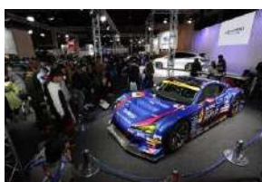
⑧ 福岡モーターショー2019の様子