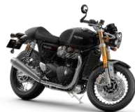
TRIUMPH Thruxton RS