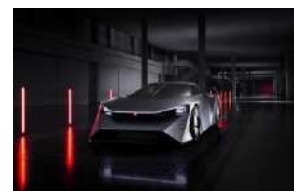
④ 「福岡モビリティショー2023」出展予定車両 Nissan Hyper Force (Nissan)