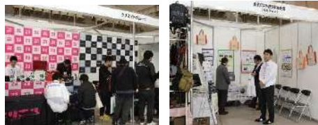
* 前回の様子「クリエイトグループ」(左) / 「自動車事故対策機構」(右)