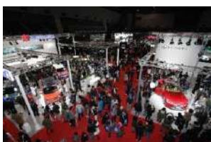
⑦ 福岡モーターショー2019の様子