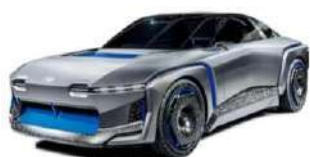
SUBARU WP SPORT MOBILITY Concept