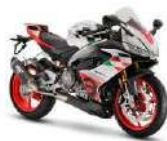
aprilia RS 660 Extrema