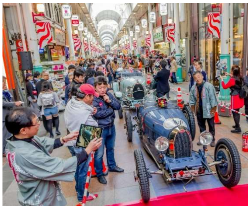
(前回(2019)の様子・スタート地点の川端通商店街)