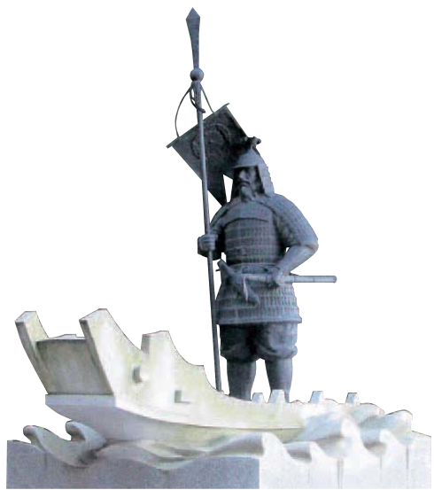
穂高神社の比羅夫像

日本最初の国史といわれる日本書紀に、あづみ族の話がいくつかでてきます。最初に書かれているのが、応神天皇の時にあづみ族の祖先である大濱宿禰が海の民の頭領に任命されたとあります。時代が下がってその中でも、日本の倭が朝鮮半島の百済