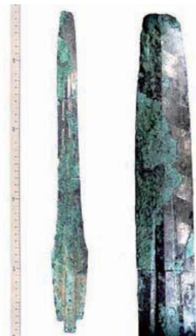
博多区月隈から出土した銅剣 福岡市埋蔵文化財センター所蔵

(注13) 鋳型…石や砂で作った型。溶かした金属を流し込んで武器や祭器を作りました。