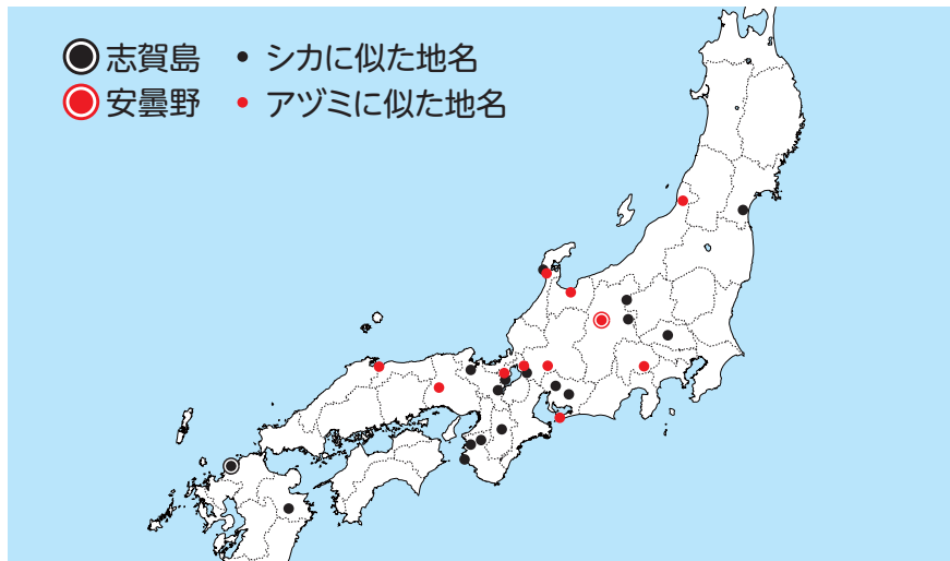
シカ・アヅミに似た地名