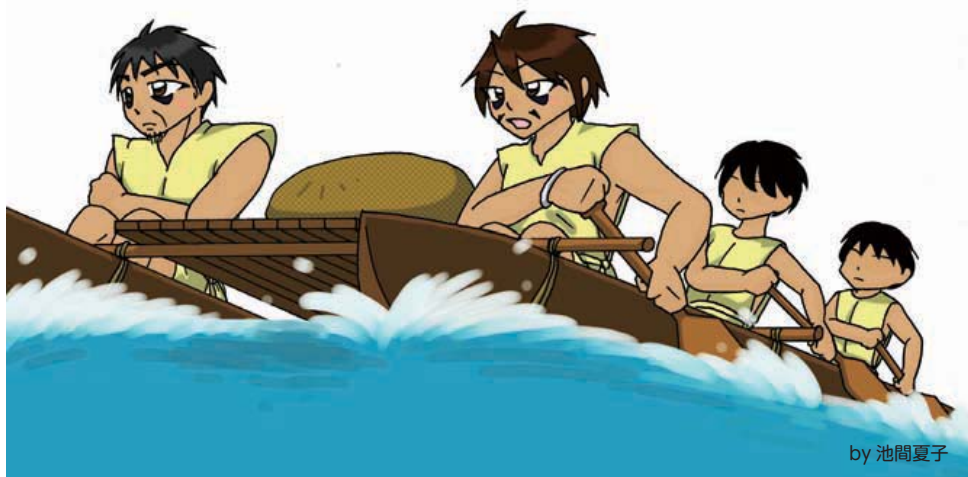
「海を渡るあづみ族」イメージ

「そつたい。昔は、飛行機もなかった。自動車もなかったし、それが通るような道もなかったたい。また、国と国をさえぎる境もなかった。海が人が行き来する一番の大きな道じゃったよ。船はそこば行き来して、人や物ば運ぶ大事なもんじゃったたい。そんな船ば動かす知識や技術を持った人たちが、あづみ族などの海洋民で、言われとる人たちたい。」と言いました。