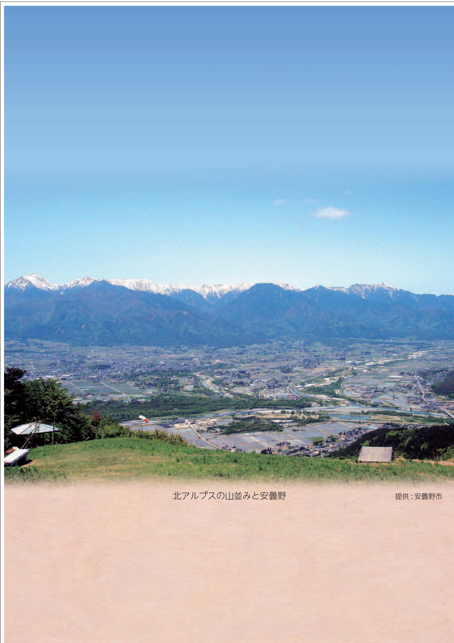
北アルプスの山並みと安曇野