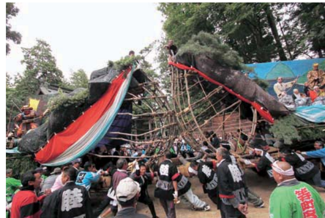
穂高神社 御船祭り