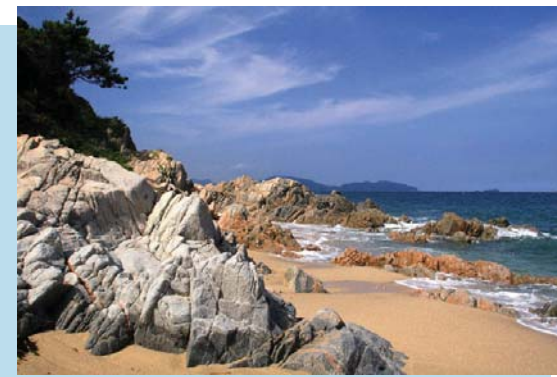
しかのしま かつまかいがん 志賀島 勝馬海岸