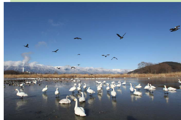
ごほうでんゆうすいち はくちょう 御宝田遊水池の白鳥