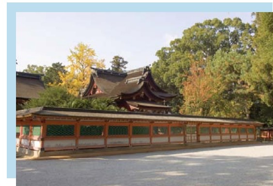
かしいぐう 香椎宮