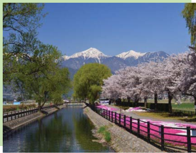
じっかせぎ 拾ヶ堰 と じてんしゃひろば