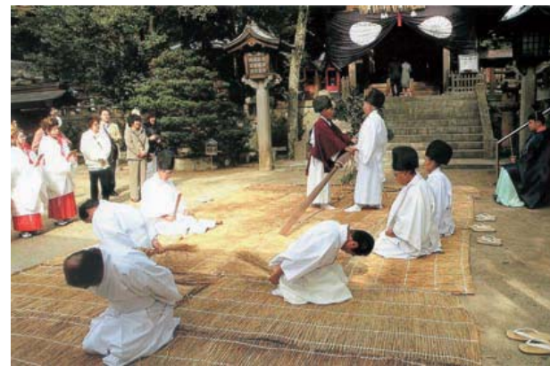
志賀海神社 山ほめ祭