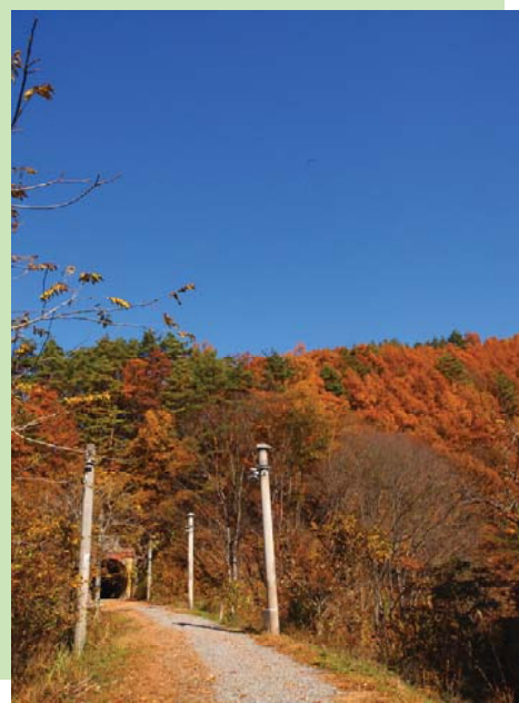
きゅうこくてつしの の いせんはいせんじき もみじ 旧国鉄篠ノ井線廃線敷の紅葉