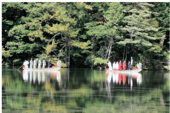
明神池の神事

そして、3000mを超す北アルプス連峰に囲まれた上高地の明神池 みんがうけ にも、穂高神社が祀 まつ られていて、海の神様が山々の守り神になっていることも知りました。その話をすると、おじいちゃんは言いました。「この志賀海神社でも、春と秋 (注21) に、『山ほめ』があらうが。