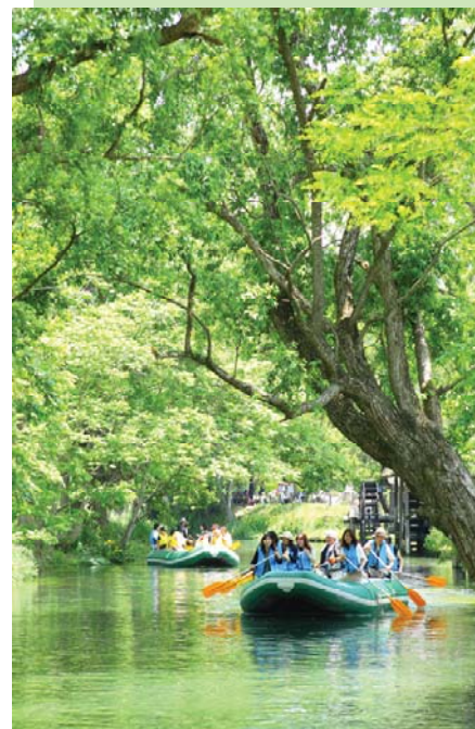
クリアボートで川下り (蓼川)