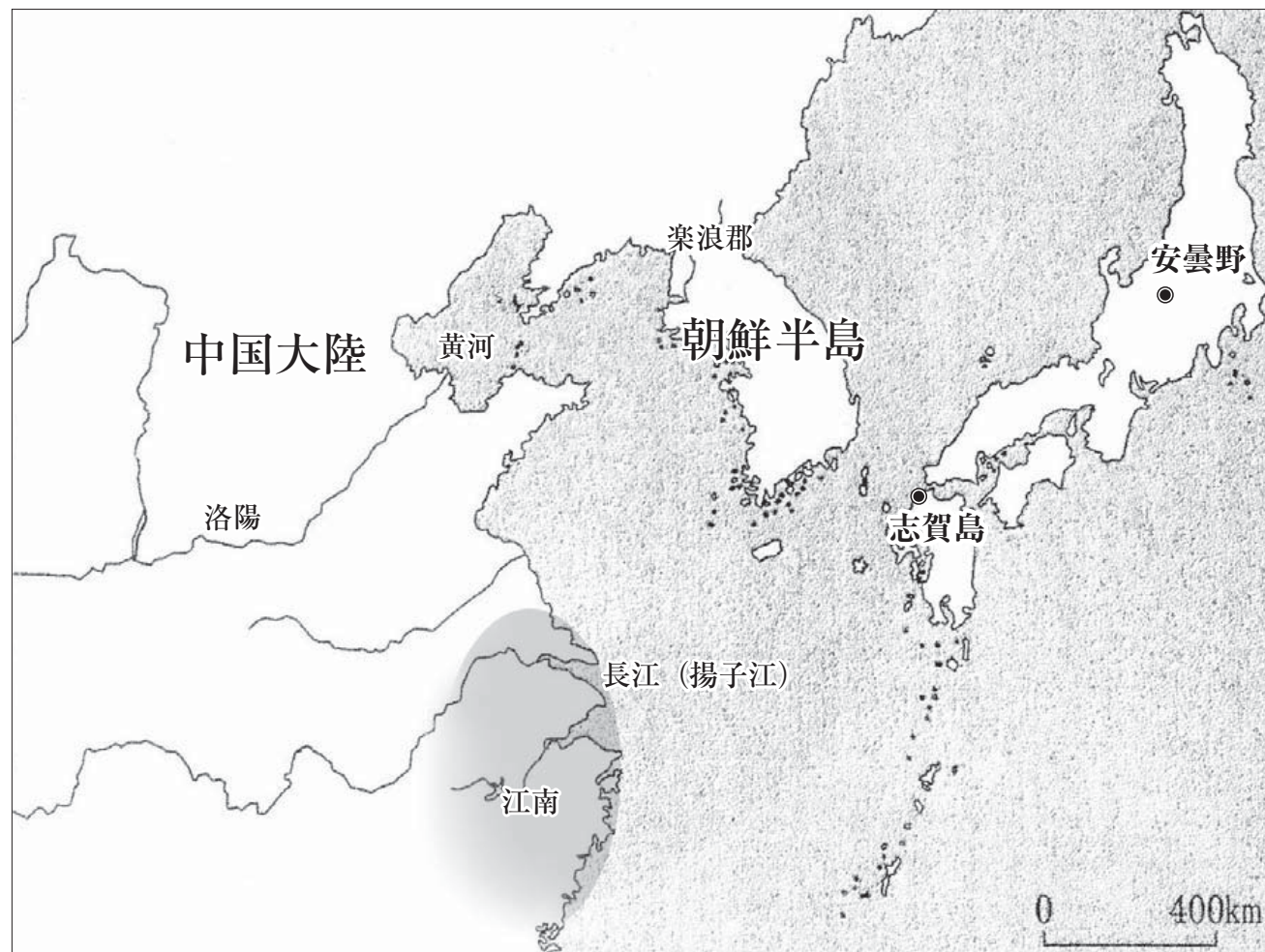
この話に出てくる地名