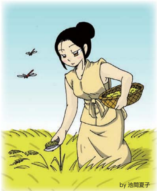
稲穂刈りの風景 by 池間夏子

あづみ族 (注4) は、古代に志賀島を拠点 きょてん に活躍 (注5) していた海洋民 かいようみん として知られている人たちです。またあづみ族は、船 ふね の扱 あつか いや海の事情 じじょう に詳しく、いろんな地方の特産物 とくさんぶつ を運 は んだりして、今 いま で言う貿易会社 ぼうえいせき みたいな働き か をしていたという説 せつ や、今 いま から2500年 にんねん ぐらい前に、中国の江南地方 (注6) から渡 わた ってきて住 す み着 き いた人たちという説 せつ もあります。さらに江南地方は、米 こめ の原産地 げんさんち とも言 い われており、日本 にっぽん に米 こめ の栽培技術 さいばいぎじゆつ をもたらししたのもあづみ族だという研究者 けんきゆうしや もいると、教えてくれました。