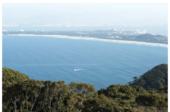
志賀島（潮見展望台）から見た福岡の市街地

「そつたいね。じいちゃんも、最初 (注3) は志賀海神社 しかがみじんじや の阿曇宮司 あづみみやうじ さんから聞いたつたい。それから本ば読んだり、交流団で安曇野に行ったりして、少しずつわかってきたつたい。」と、話を始めました。