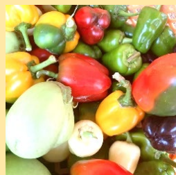
穫れたて新鮮野菜(ピーマン、なす、生姜など)