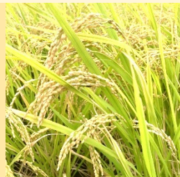
さつまいも(紅はるか、シルクスイートなど)、新米