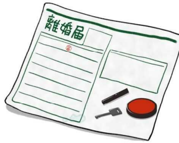
離婚せず、修復したい