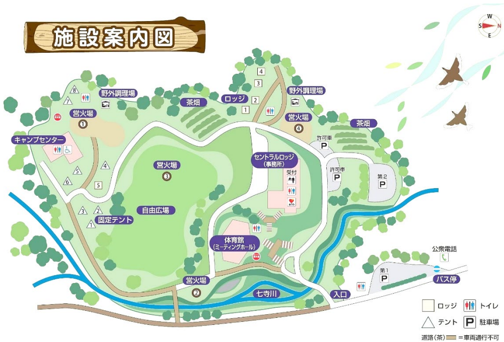
図2 本施設内配置図