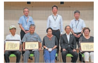
区役所で行われた表彰式

市は、定期的な清掃など道路愛護に取り組む、顕著な功績を挙げた市民を表彰しています。今年度は東区から「青葉校区防犯組合 女性パトロール隊」「照葉シニアクラブ」「箱崎校区自治協議会 箱崎花の会」の3団体が受賞しました。☎区地域整備課 ☎645-1051 ☎632-8999