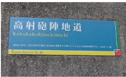
道路横にある「高射砲陣地道」のパネル