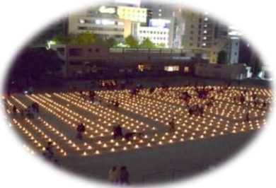
昨年度の灯明まつりの風景

また、自治協ブログ「堅粕たうん」でも情報を掲載しますので、アクセスをお願いします。