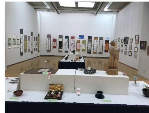
福岡市障がい児・者美術展