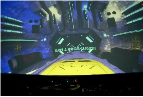
2021年 3月13日(土)開催COSMIC DANCEの様子