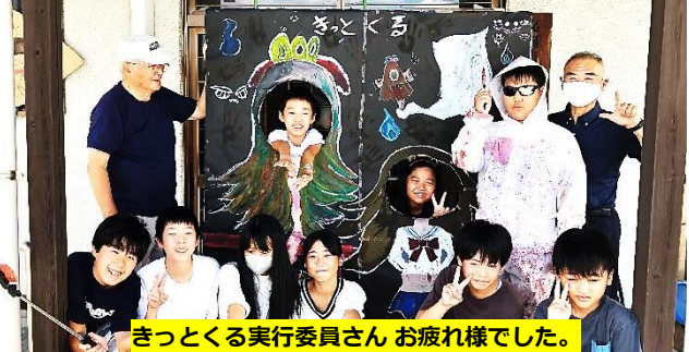
きつとくる実行委員さん お疲れ様でした。