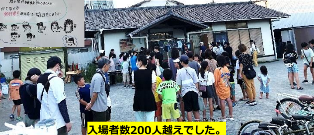
入場者数200人越えてした。