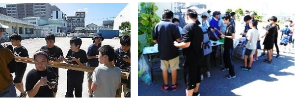
共催: 青少年育成連合会

「環境美化・ごみ減量推進・紙資源のリサイクル推進」に、皆様のご理解とご協力お願い致します。 松島公民館裏に、「紙リサイクルステーション」を設置しています。毎日(土日祝日も)9~17時までご利用できます。 但し年末年始・お盆は休みです。企業からの持込はご遠慮下さい。 持ち込めるのは、「新聞・チラシ・雑誌・ダンボール・牛乳パック」等、リサイクル可能な紙類のみです。必ず種類別に十文字に紐掛けしてお待ち下さい。袋入り、ガムテープ止は持込禁止。