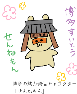
博多の魅力発信キャラクター「せんねもん」