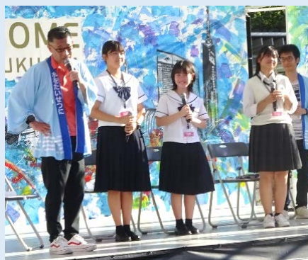
8/5トークイベントの様子

初めての 高校生とのコラボ企画! 高校生主体 で行うこのプロジェクト を多くの方に知っていただきたく、 プロジェクトの成長する過程の取材 をよろしく願いいたします。