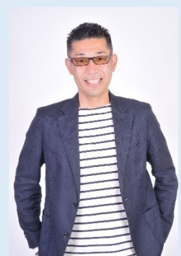
(※写真は両校顔合わせの様子と福岡市水道局公式アンバサダー中島浩二氏)