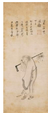
伝・牧谿《五祖荷鋤図》(重要文化財) 元時代 14世紀 ※半期展示