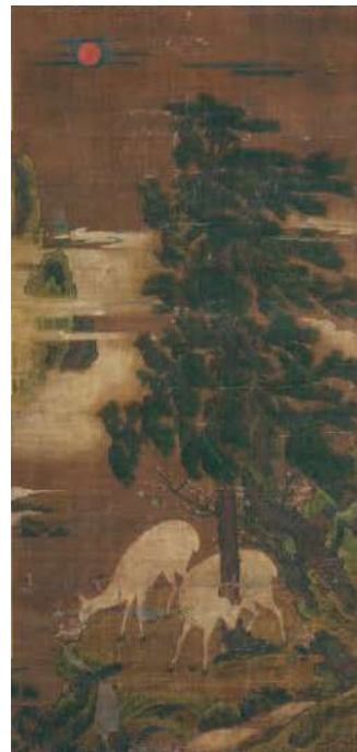
《十長生図》 二幅 朝鮮時代中期(16世紀後半)