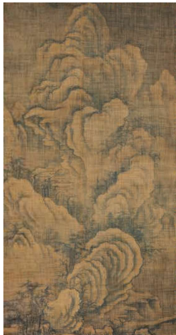
《雪景山水図》 朝鮮時代前期(15世紀後半)