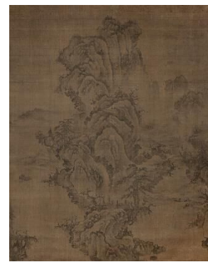
《山水図》朝鮮時代15世紀 個人蔵