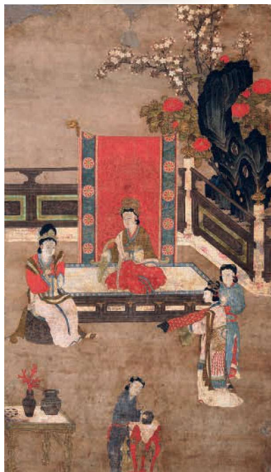
《宮女図》 朝鮮時代前期(15世紀後半)