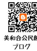
美和台公民館 ブログ