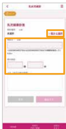
「一覧から選択」から受診機関を選択し、予定日時を入力後、「確認する」をタップ