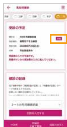
登録した予定を確認し、「詳細」をタップ