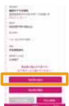
「受診票の提出」をタップ