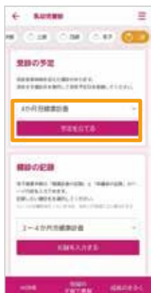
対象の健診名を確認し、「予定を立てる」をタップ