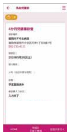
この画面で問診票の入力は完了