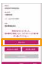
「受付する」をタップ