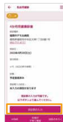
「受診票の入力」をタップ ※画面上、「受診票」の表記になっておりますが、問診票の入力画面にすみます。