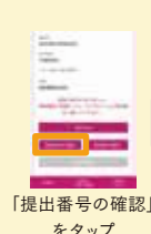
「提出番号の確認」をタップ

パートナーが受付する場合は、事前に「提出番号の確認」ボタンをタップし、提出番号を発行してください(健診当日3日前より発行可能)。その提出番号をパートナーに共有ください。