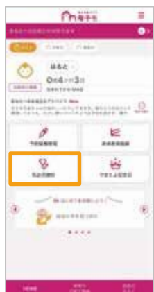
TOPメニューの「乳幼児健診」をタップ