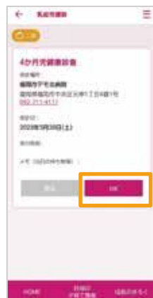
「OK」をタップ この画面で予定の入力は完了