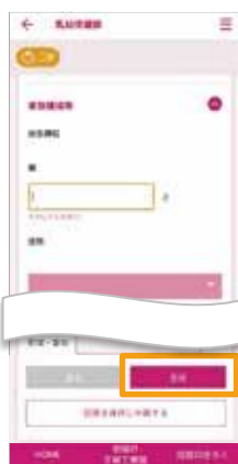
各項目をすべて入力し、「登録」をタップ