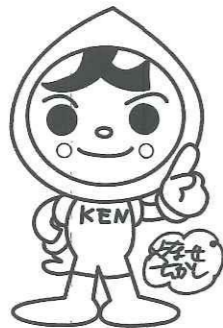
人権イメージキャラクター 「人KENまもる君」

人権に関するご相談を、土日祝日を除く毎日午前8時30分から午後5時15分まで（時間外及び土日祝日は留守番電話対応）受け付けています。