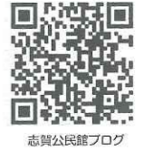
志賀公民館ブログ