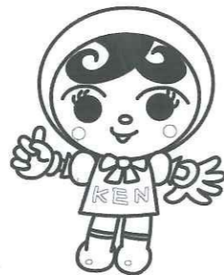
人権イメージキャラクター 「人KENあゆみちゃん」