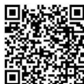
証明発行コーナー