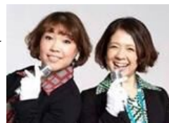
レディバスのお二人