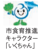
市食育推進キャラクター「いっちゃん」

日々の食事は、活動に必要なエネルギーや栄養を補うために全ての人間にとって欠かすことができません。いつまでも健康でいるために、若いうちから毎日の「食」について考えることが大切です。