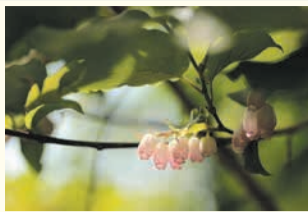
ネジキ (油山市民の森)