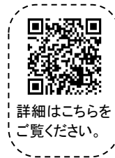
詳細はこちらをご覧ください。

子育てのお手伝いをしてみませんか! ～福岡ファミリー・サポート・センター～ 提供会員になるには、3日間の講習会を受講する必要があります。 ■日程：7/12(水) 10:00～14:30 7/21(金) 10:00～15:00 7/25(火) 10:00～15:00 ■会場：市民福祉プラザ ■託児有(要申込、先着順) ■申込方法 電話・メール・FAXで、下記宛にお申込みください。 ■申込期間：6/1～7/5(先着順) 社会福祉法人福岡市社会福祉協議会 福岡ファミリー・サポート・センター本部 TEL:736-1116 FAX:713-0778 Eメール:f-support@fukuoka-shakyo.or.jp