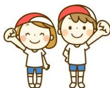
青少年育成連合会

やわらかいフリスビーだから痛くないよ！知っている子も知らない子も一緒にやろう！ 🕒 日時：6月18日(日) 8:30 受付 9:00 開始 📍 場所：玉川小学校 体育館 👤 対象：3・4年生、保護者 👜 持ち物：動きやすい服装、上靴、水筒、タオル ～お願い～ お手伝いできる保護者の方も募集中！ご協力をお願いします