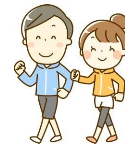
健康・献血推進連合会