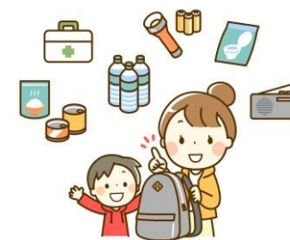
男女共同参画協議会