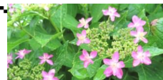
アジサイ咲きました