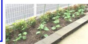
5/12 今年もゴーヤ植えました。