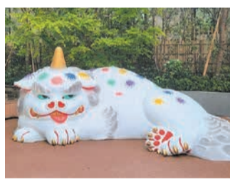
狛犬を眺めながら近くのベン チでくつろげます

この石垣は、1977 年の地下鉄空港線工事中 に発見されたもので、無 きことがありません。