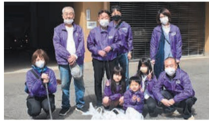
子どもも大人もみんなで協力してごみ を拾いました