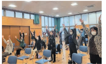
みんなで元気にラジオ体操