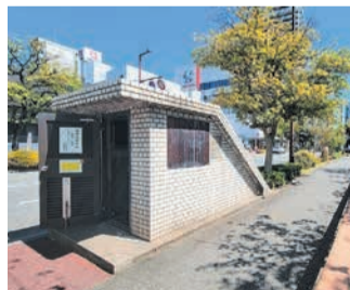
石垣保存施設の入り口

この石垣は、1977 年の地下鉄空港線工事中 に発見されたもので、無 きことがありません。