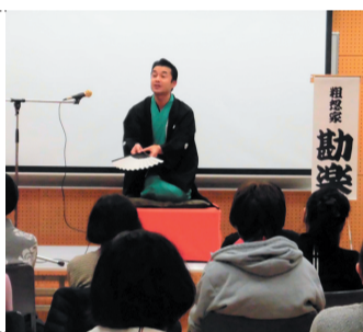
地域コミュニティ落語

見守りの体験談や地域活動のクイズを通じて、地域のことや活動内容について学びます。講師は民生委員などが務めます。※開催校区により内容が変わります。