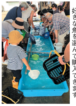
好きな魚を選んで購入できます

志賀島の近海で取れた新鮮な魚介類などを販売します。5月13日～12月23日の第2・4土曜日午後2時～ ※売り切れ次第終了 弘漁港 市漁業協同組合弘支所 ☎603-6611 ☎603-2755