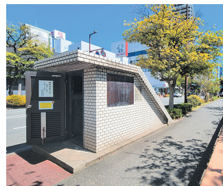
石垣保存施設の入り口

今年1月にオープンした福岡大名ガーデンシティの広場(大名二丁目) ●大名の大狛犬 が訪れる場所です。