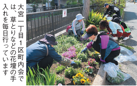
大宮二丁目1区町内会では、草とりなどの花壇の手入れを毎日行っています

自治会・町内会の活動 は、子どもや高齢者の見 守り、防犯・防災や環境 美化活動、コミュニケー ションを図るイベントな ど、多岐にわたります。 地域が抱える問題を解