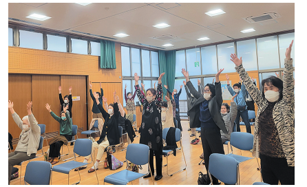
みんなで元気にラジオ体操

の「にここサロン」を 開催しています。サロン では、高齢者がさまざま なイベントを通して交流 しています。