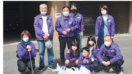
子どもも大人もみんなで協力してごみを拾いました

ると、一体感を感じます。 清掃時にまち行く人から 声をかけられることも活 動の励みになっていま す」と話していました。