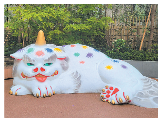
狛犬を眺めながら近くのベンチでくつろげます

今年1月にオープンした福岡大名ガーデンシティの広場(大名二丁目) ●大名の大狛犬 が訪れる場所です。