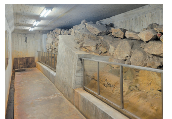
石垣の他にも福岡城について学べるパネル展示があります

には、巨大な狛犬のモニュメントが設置されています。この狛犬は「大名の森に住む守り神」をコンセプトに作られ、子どもたちが登ったり、寝転んだりして遊べる遊具です。