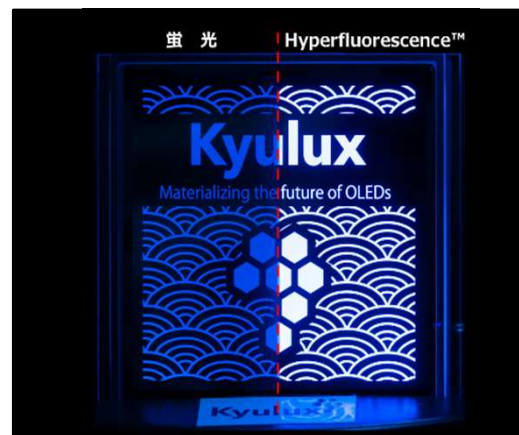
有機ELパネルの発光写真：