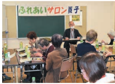
食事をしながら歓談

者同士でお茶を飲みながら談笑したり、同委員も話しに加わったりして、和やかな時間を過ごしました。