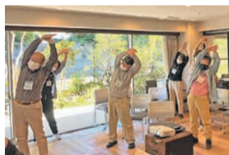
グランダ高宮で行われるよかトレの様子

市は、「足元気体操」や「祝いめでた体操」、「黒田節体操」などの6つの体操を「よかトレ」と名付けて、介護予防に効果のある運動として推奨しています。