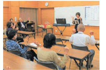
音楽に合わせて脳トレ

参加者は「普段なかなか大きな声を出すことがないので、みんなで歌ってストレス発散になりました」「毎回興味深い内容なので、友達を誘って参加しています。地域の