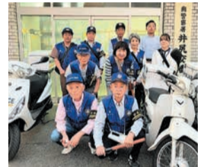
宮竹校区のパトロールに 出発する補導員の皆さん

区内では、警察から委嘱された61人の少年補導員が、月に1回、交代でパトロールを行っています。6月9日には宮竹校区で、8人の補導員と南警察署員によるパトロールが行われました。