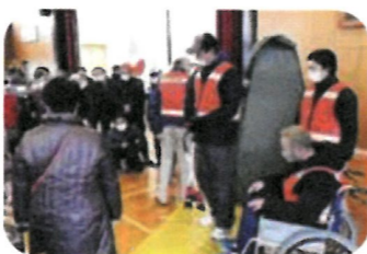
②避難所・防災倉庫の備蓄食料・資機材展示・体験