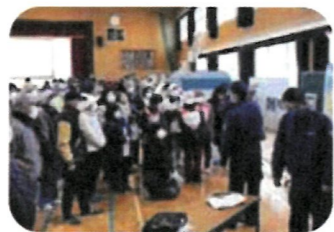
③福岡の過去の災害、校区のハザードマップを学習