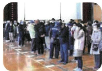
①各町内毎に集合し安否確認後、体育館へ避難

このような訓練を定期的を実施することで防災意識の継続に繋がればと思います。皆様大変お疲れ様でした。