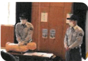
④食べ物などが喉に詰まった!!異物除去法の学習・体験